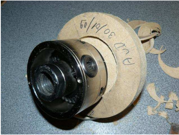
Mandrin serré sur le rond de 40