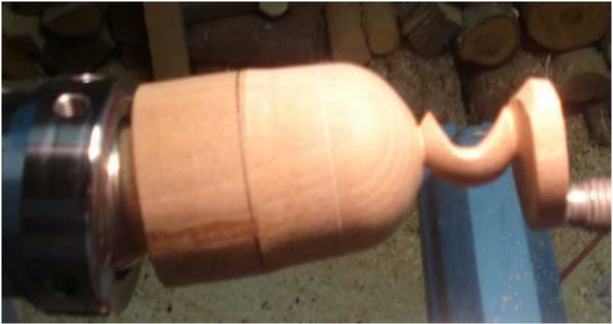
Perçage de l'emplacement du fleuron diamètre 6