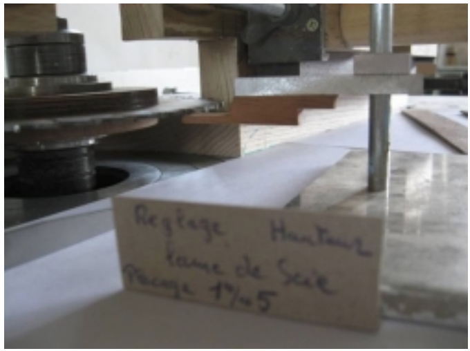
Réglage de la lame :