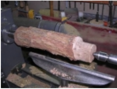
Tournage du morceau de shinus